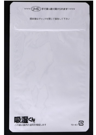
規格袋写真 (T0-A1 100mm×160mm)

両者において共通する「小ロット」への対応に向けて、2サイズの規格袋を販売致します。